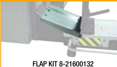
FLAP KIT 8-21600132