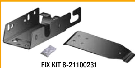
FIX KIT 8-21100231