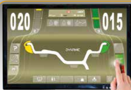
MONITOR 16/9 - 22"